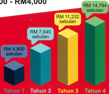
Anggaran Pendapatan Bulanan Untuk 2 Kes Seminggu